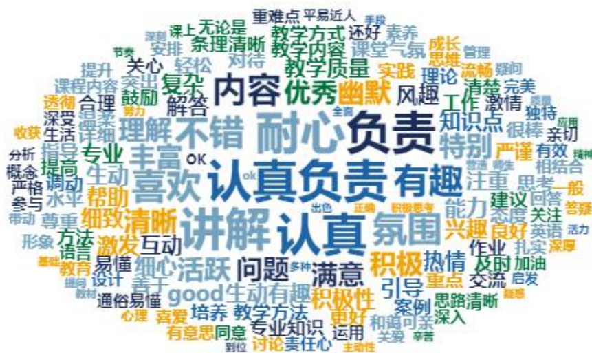
图 1 期中学生评教主观评语词云图