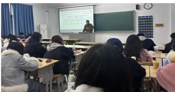
巡视情况良好的课堂实拍