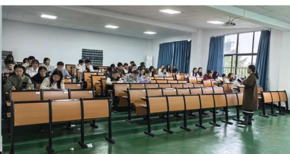
前排就座率低的课堂实拍